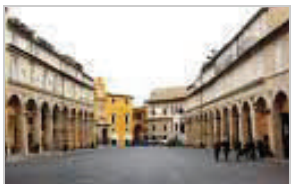
Palazzo dei Priori

Ore 12.00 —arrivo a FERMO. Subito visita con guida al